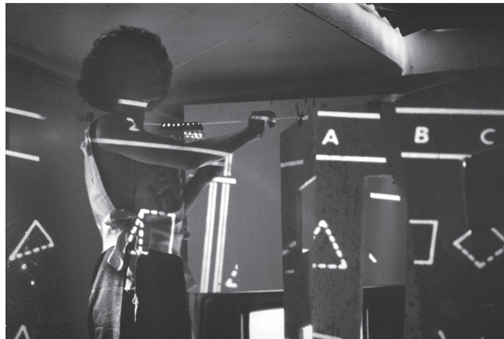
Geschiedenis , Holland Festival/Time Based Arts, Amsterdam 1985