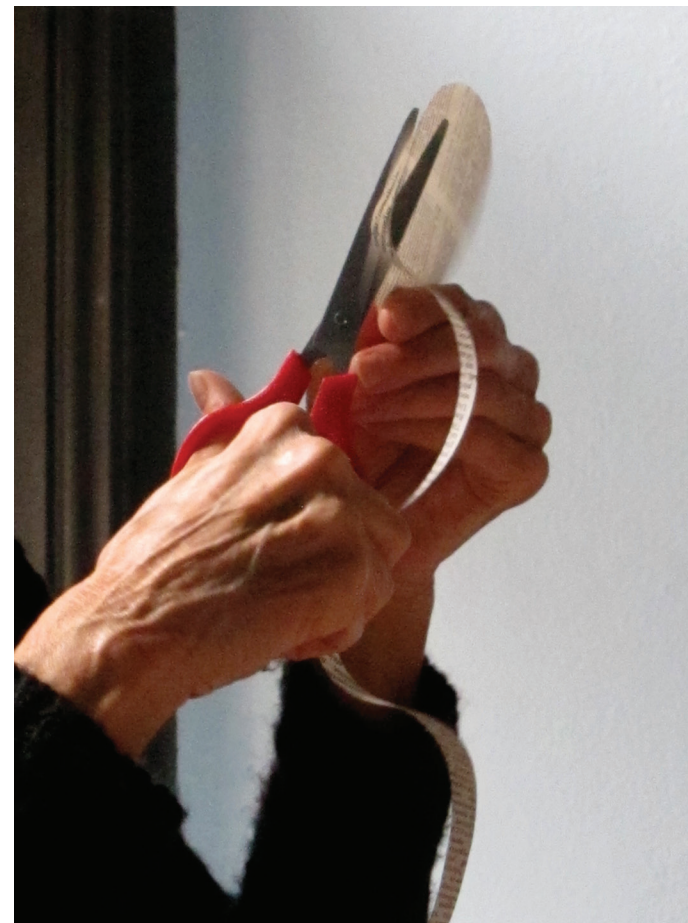
DROPPING WINEGLASS FALLING DOWN , Babble (Babel), Toronto 2013