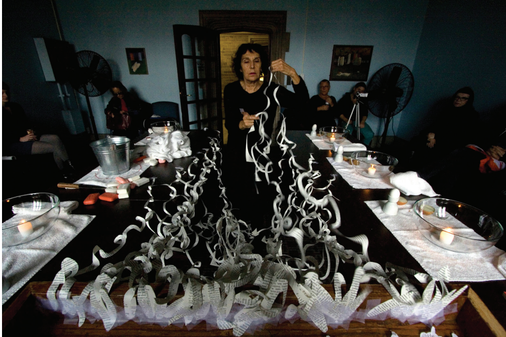
DROPPING WINEGLASS FALLING DOWN, Babble (Babel), Toronto 2013