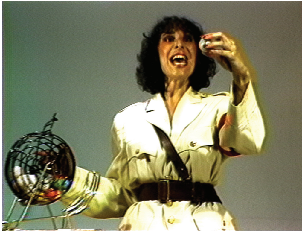
Unbashed Heroics, Video Still, 1982