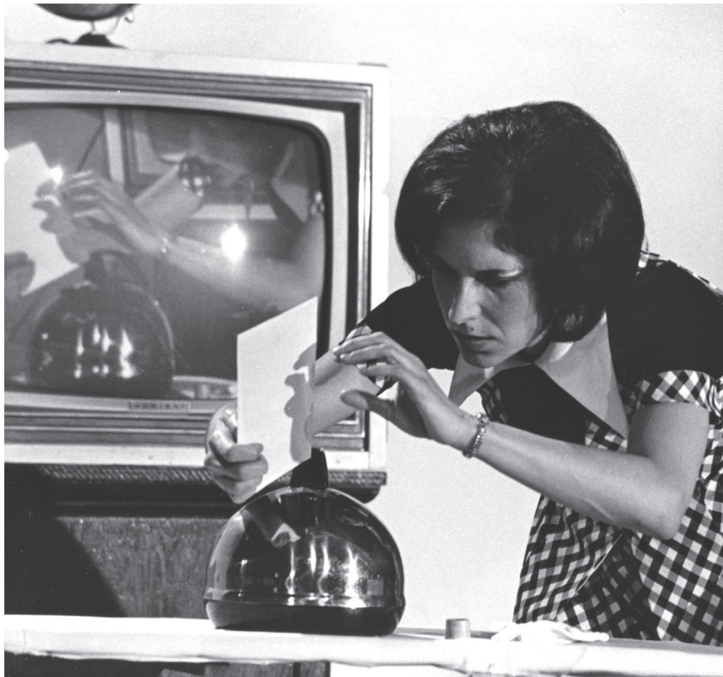
As the World Burns , Western Front, Vancouver 1977