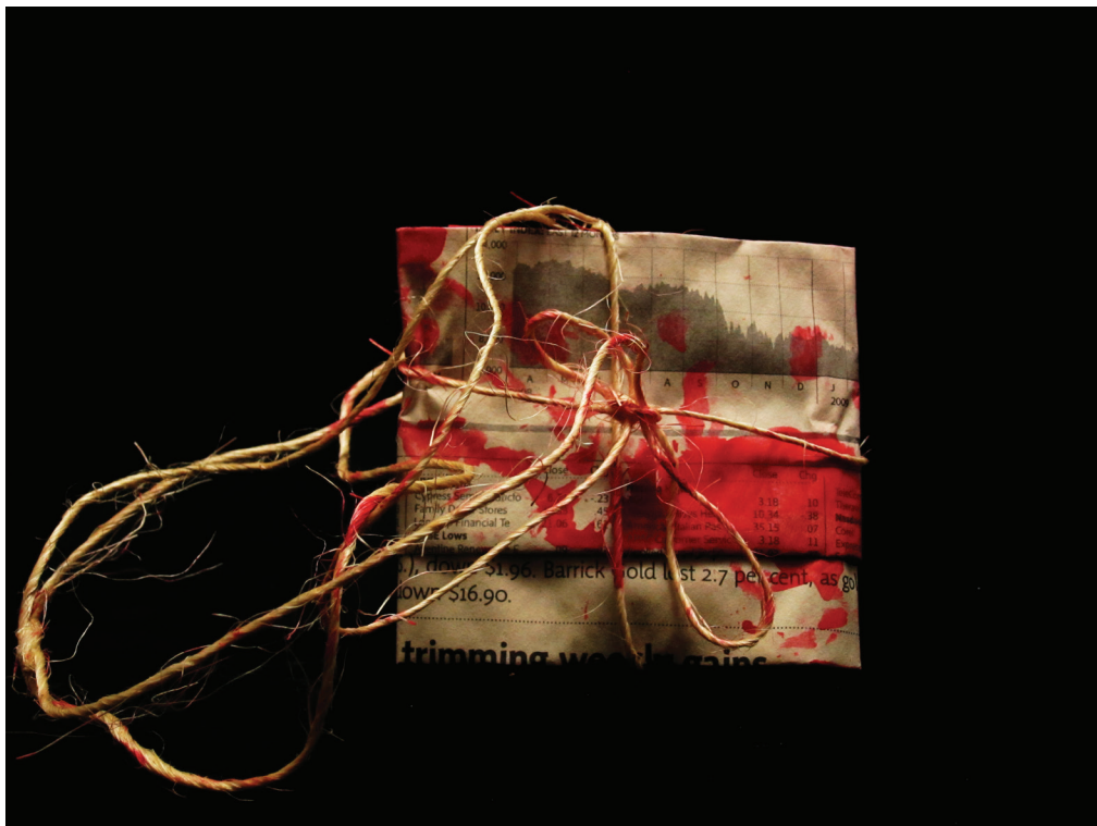
Dirty Little Secrets, 2009–2011 (Detail)