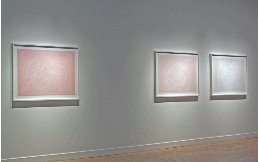
Erin Gee, Larynx2, Larynx1, Larynx4 , 2015. Installation view.