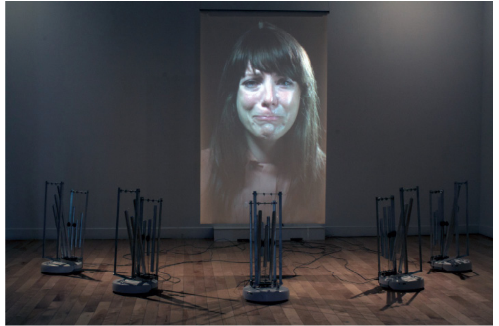
Erin Gee, Swarming Emotional Pianos , 2015. Installation view.