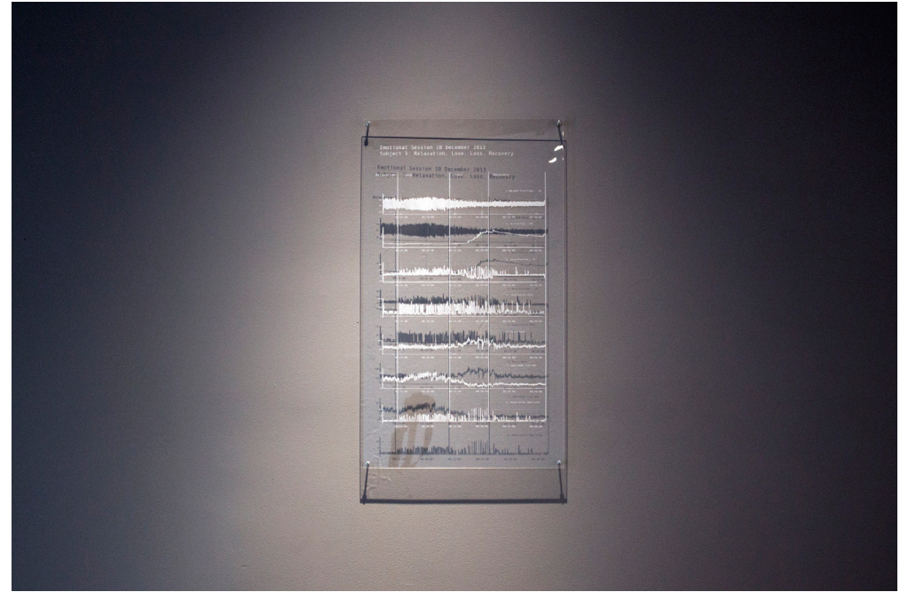
Erin Gee, Data from emotional sessions, 10 December, 2013, 2016 . Installation view.