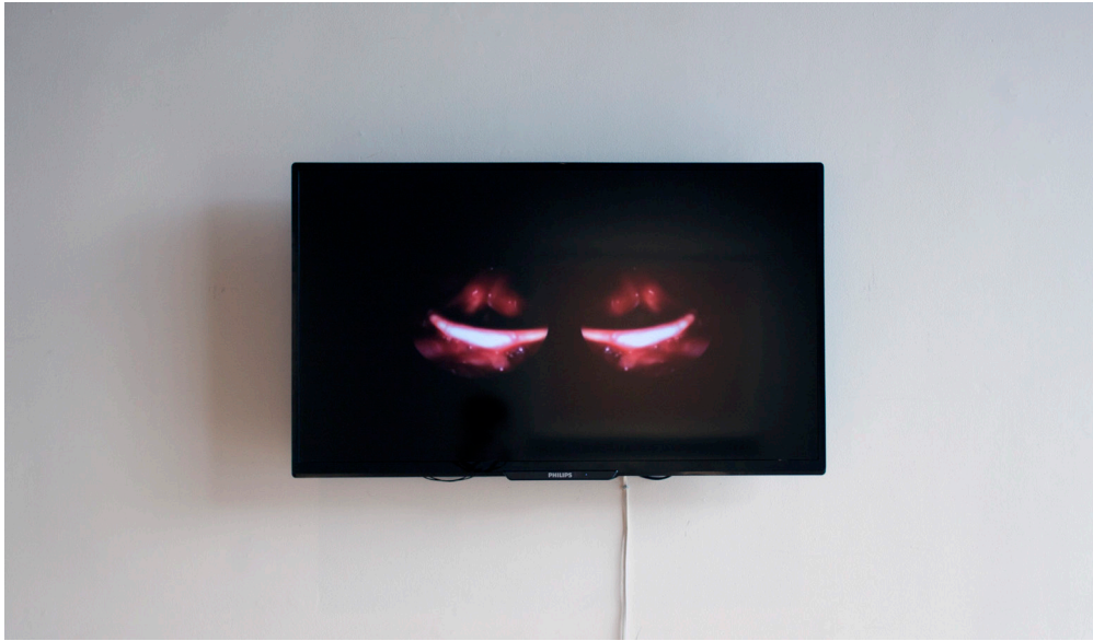
Erin Gee, Eye is a throat is a twin , 2015. Installation view.