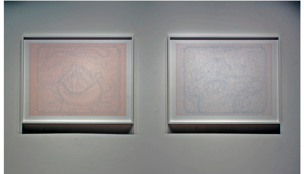
Erin Gee, Larynx1 & Larynx4 , 2015. Installation view.