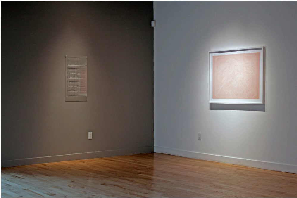
Erin Gee, Data from emotional sessions, 10 December, 2013, 2016 & Larynx2, 2015 . Installation view.