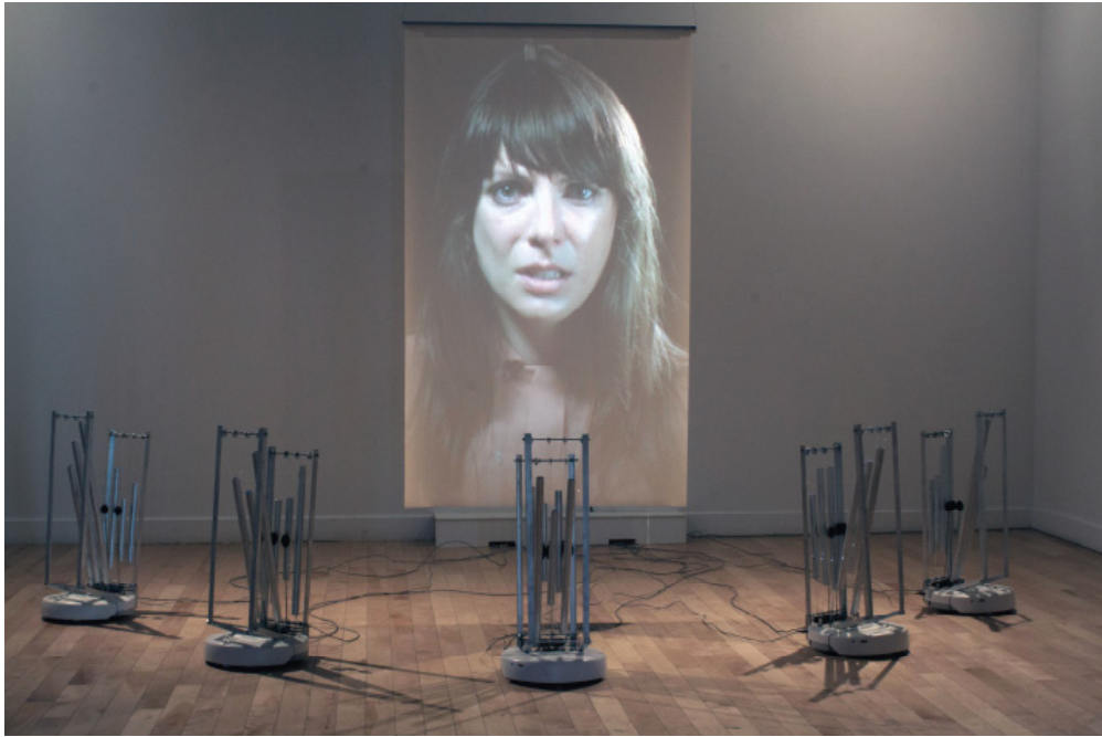
Erin Gee, Swarming Emotional Pianos , 2015. Installation view.